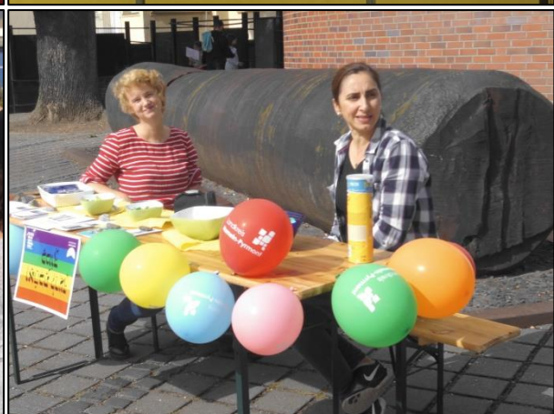
Fotos oben: Südstadtgespräch; Fotos unten: Südstadtorientierungslauf