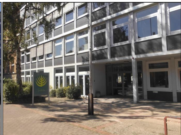
Fotos: links: Wilhelm-Raabe-Schule, Standort Königstraße; rechts: Vikilu, Standort Grütterstraße